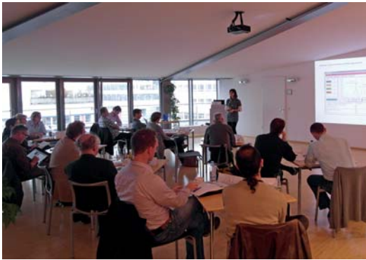
Die UV-Seminare der Dr. Hönle AG sind von Anfang an ein großer Erfolg.

Seit fast 40 Jahren entwickelt, produziert und vertreibt die Dr. Hönle AG UV-Geräte und UV-Systeme. Ob UV-Trocknungssysteme für die grafische Industrie oder UV-Aushärtegeräte für eine Vielzahl von industriellen Anwendungen – Hönle gehört weltweit zu den anerkanntesten und erfolgreichsten UV-Spezialisten. Diesem Erfolg zugrunde liegt ein großer Erfahrungsschatz sowie stetiges Forschen und Entwickeln. Der Anspruch, immer besser und zeitgemäßer zu werden, macht Hönle auch heute noch zu absoluten Trendsettern der Branche und Hönle-Produkte im höchsten Maße innovativ.